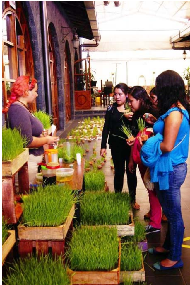
Figura 7. Explicación sobre el cultivo tan simple y económico de los germinados y su valor nutricional