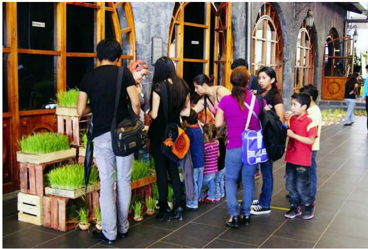
Figura 6. Explicación sobre el cultivo tan simple y económico de los germinados y su valor nutricional.