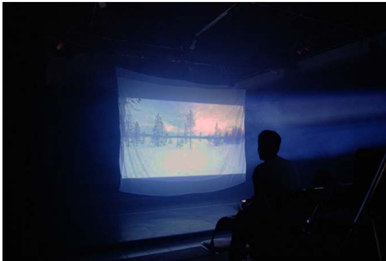
Figura 3. Proyecciones y ambientación sensorial, sonido, y aromas de un “ mundo ecológico ideal y nostálgico ”

Del trabajo profesional, surgen todas las reflexiones sobre las nuevas prácticas artísticas, que también ayudan de paso a pensar algunos aspectos de nuestra propia sociedad ya que tanto los objetos como las prácticas artísticas los podemos ver como portadores de diálogo social, permitiéndonos observar algunos rasgos de la sociedad contemporánea. En ese sentido y en concreto sobre la EE Proyectos de las Artes Visuales, fue una experiencia que dejó buenos frutos, sin embargo, es importante recalcar que aún existen muchos problemas de concepción y significado de lo que podemos definir como vinculación, ya que esta encierra muchas formas de pensamiento.