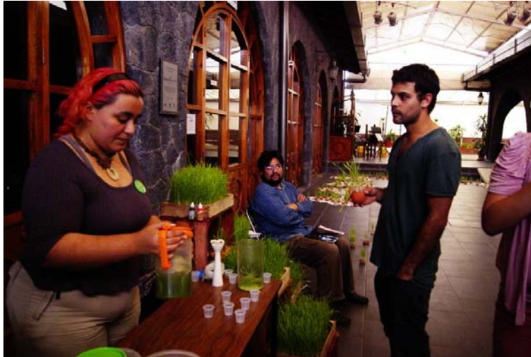
Figura 8. Se obsequia jugo del germinado a los asistentes en un acto de performance

Trabajar un proyecto artístico o cultural como se propuso, donde el tema estuviera inmerso en arte-sustentabilidad y propiciara una relación social más estrecha e incluyente a través de la vinculación, fue un trabajo arduo, pero que nos ha dejado no sólo satisfechos, sino con ganas de seguir insistiendo a nuestros estudiantes insertarse en la realidad social de nuestro momento y formarse nuevos retos, no es por demás acercarlos de cualquier forma al mundo profesional del arte contemporáneo a través de la vinculación y la planeación de proyectos. En el proyecto realizado “Ciclos en Reflexión”, se hizo evidente el uso de materiales tecnológicos dentro de la instalación artística, acercó de manera acertada al público, puesto que las proyecciones y materiales recabados de sitios de internet, fotografías digitales, y la edición de los videos fueron parte esencial de la misma. "La originalidad formal en el manejo de los materiales, el uso novedoso de la tecnología reciente, parten de cambios sociales y reglas técnicas que los hacen posibles" (Canclini, 2006, falta número de página).