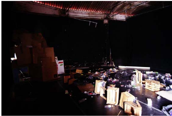
Figura 1. La degradación del medio ” instalación artística haciendo referencia a la contaminación ambiental