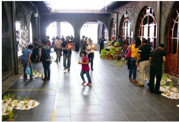
Figura 4. Instalación con pequeños contenedores de germinados de trigo para realizar un trueque y obtener a cambio una reflexión o pensamiento ecológico.