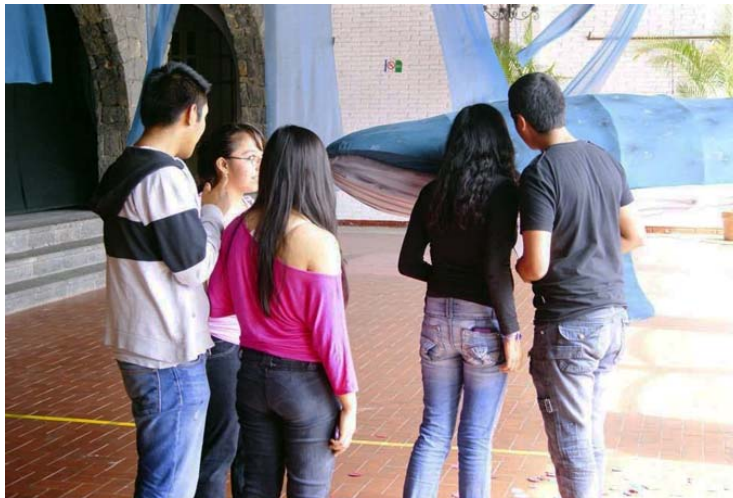
Figura 2. La ballena-proyector ”, con proyección de video en el interior de un ojo.