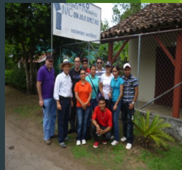
Imágenes del Museo Don Julio Gómez Ruiz